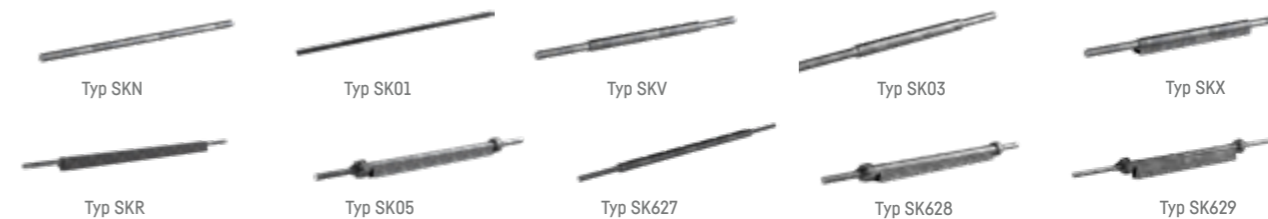
Typ SKN Typ SK01 Typ SKV Typ SK03 Typ SKX Typ SKR Typ SK05 Typ SK627 Typ SK628 Typ SK629