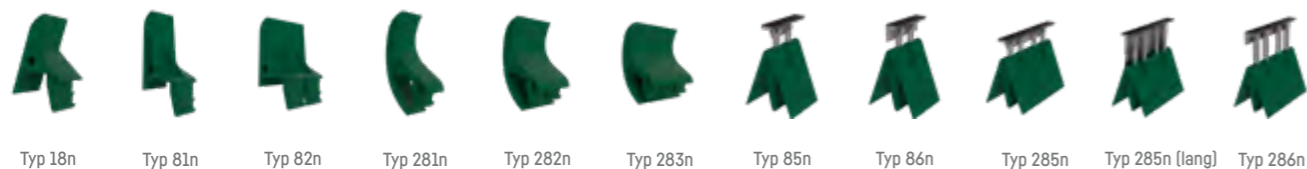
Typ 18n Typ 81n Typ 82n Typ 281n Typ 282n Typ 283n Typ 85n Typ 86n Typ 285n Typ 285n [lang] Typ 286n