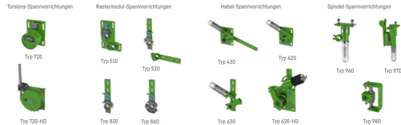
Torsions-Spannvorrichtungen: Typ 720, Typ 720-HD Rastermodul-Spannvorrichtungen: Typ 510, Typ 520, Typ 830, Typ 860 Hebel-Spannvorrichtungen: Typ 430, Typ 620, Typ 630, Typ 620-HD Spindel-Spannvorrichtungen: Typ 960, Typ 970, Typ 980